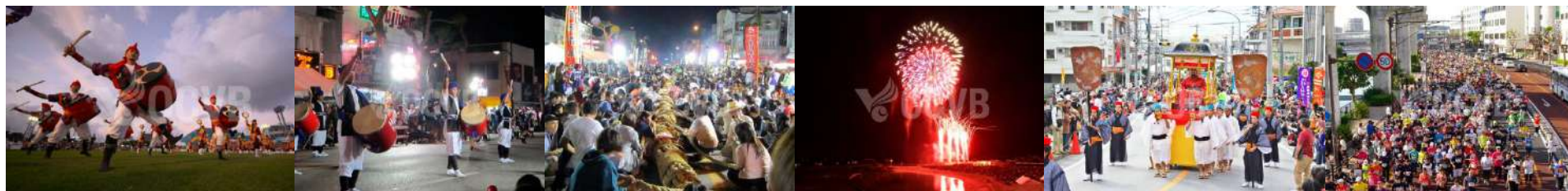
沖縄フェスティバルウィーク

TEJ期間中、沖縄県全体でお客様を歓迎するという趣旨のもと、沖縄フェスティバルウィークを開催。 沖縄県全土がお祭り・イベント満載で、 日本全国そして世界各国 からお客様が集まり、多くの人々に沖縄の魅力をアピール。 例年は前後開催のお祭り・イベントも、2020年だけは特別にこの期間に開催できるよう、現在調整しています。