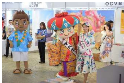
入場口付近の様子